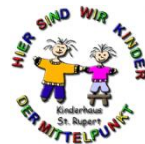
Kinderhaus St. Rupert