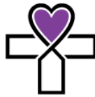
Kinderhaus Herz Jesu