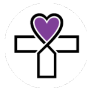
Kinderhaus Herz Jesu