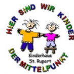
Kinderhaus St. Rupert

der Kindertageseinrichtungen des St. Vinzentius Zentralvereins München KdöR