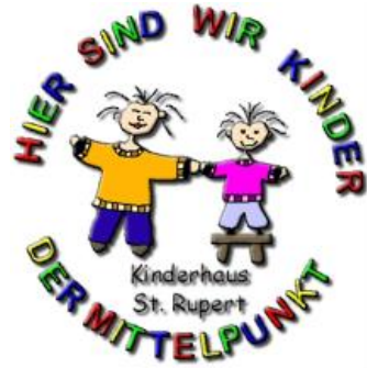
Kinderhaus St. Rupert

der Kindertageseinrichtungen des St. Vinzentius Zentralvereins München KdöR