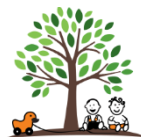
Kinderkrippe St. Rupert