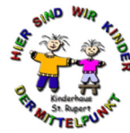
Kinderhaus St. Rupert