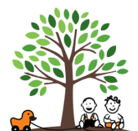
Kinderkrippe St. Rupert