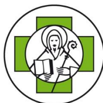
Kinderhaus St. Benedikt