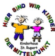
Kinderhaus St. Rupert