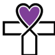
Kinderhaus Herz Jesu