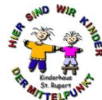
Kinderhaus St. Rupert